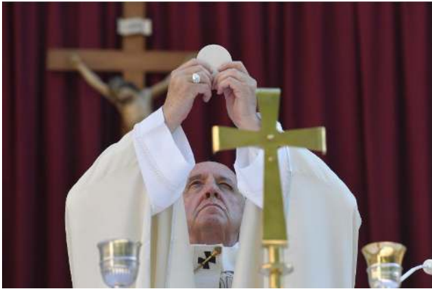
Papa Francisco en celebración eucarística.

El 17 de septiembre de 2021 el papa Francisco recibió a los participantes del encuentro "Catequesis y catequistas para la nueva evangelización" organizado por el Consejo Pontificio para la Promoción de la Nueva Evangelización.