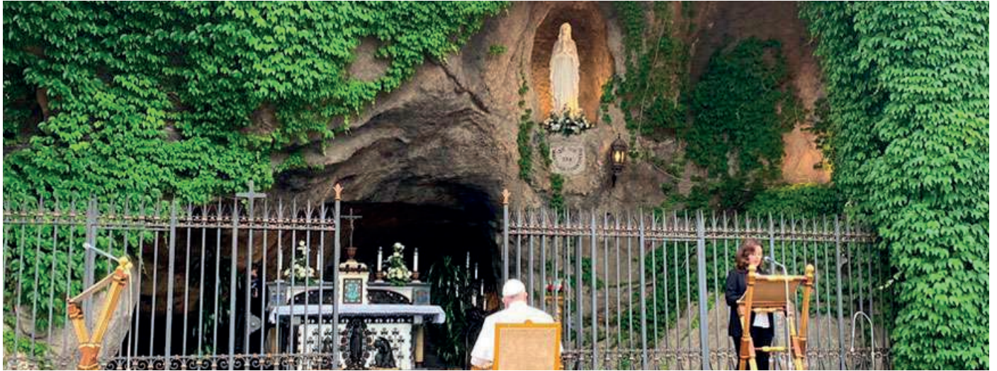
Papa Francisco reza el Rosario en los Jardines del Vaticano.

En una conexión con el mundo entero, el sábado 30 de mayo a las 17.30 horas, desde la Gruta de Lourdes en los Jardines del Vaticano, el papa Francisco presidió el rezo del Rosario a la Virgen María para pedir ayuda y socorro ante la pandemia del Covid-19. Así mismo, oró por los enfermos, los fallecidos y sus familiares, así como por todos los profesionales y voluntarios que luchan contra la enfermedad.