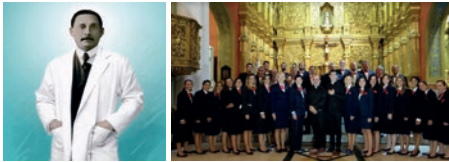
Beato José Gregorio Hernández / La Coral Betania en la Iglesia de La Candelaria, lugar donde reposa el cuerpo del beato Dr. José Gregorio Hernández

La Congregación para la Causa de los Santos promulgó el 19 de junio de 2020, el decreto con la autorización del papa Francisco para la beatificación del venerable Dr. José Gregorio Hernández. La noticia llenó de alegría a toda Venezuela. José Gregorio Hernández fue un médico venezolano de profunda vocación religiosa, católico, reconocido por su solidaridad con los más necesitados.