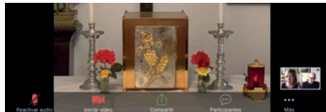
Oración ante el Santísimo Sacramento