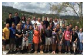
Comunidad de Betania X en Los Teques