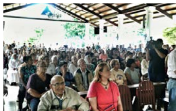
Peregrinos en la Santa Misa del 39º aniversario de la Virgen