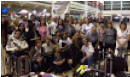
La Fundación Betania recibiendo a peregrinos de Perú y Estados Unidos

En nombre de Betania V y VII quiero decirles: ¡Muchísimas gracias!