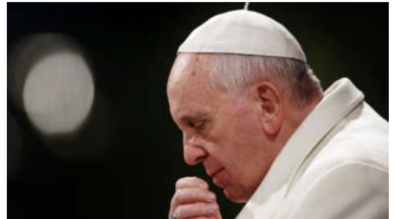
El papa Francisco llama a la oración y caridad

¡Que este mensaje sea para los cristianos una práctica diaria!