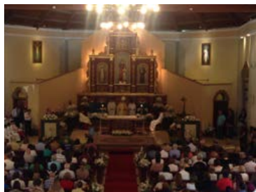
El nuncio y sacerdotes celebrando la Misa en la Iglesia Santa Ana