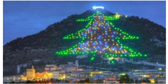
Papa Francisco encendió el árbol de Navidad

Además añadió: "Si tienen algo oscuro en el alma, pidan perdón al Señor. Navidad es una buena oportunidad para dejar limpiar el alma. No tengan miedo, el sacerdote es misericordioso, perdona a todos en nombre de Dios, porque Dios lo perdona todo."*